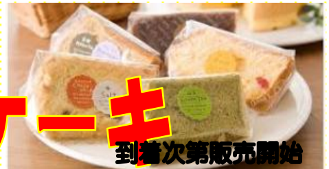
到着次第販売開始